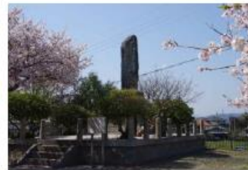
〈添田壽一の顕彰碑〉