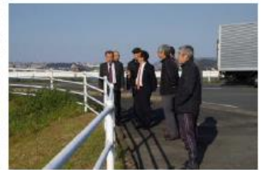
〈顕彰碑隣の遠賀川周辺視察〉